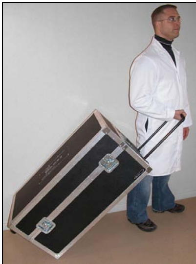
坚固的包装运输箱.