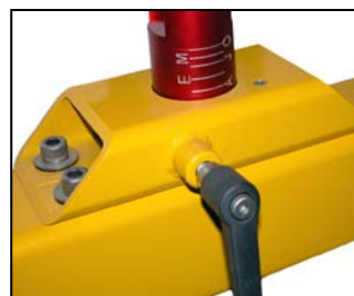
高度调节装置, 适合所有尺寸头模.