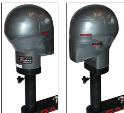
头模可 360° 旋转