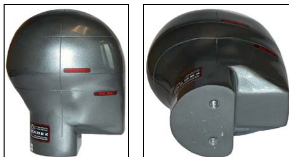
颈部改进过的 'A' 和 'J' 尺寸头模.

我们的测试设备始终在不断改进, 因此详细信息可能有所变化。Cadex Inc 公司保留产品更改权利, 恕不另行通知。/ rev 2010c-1