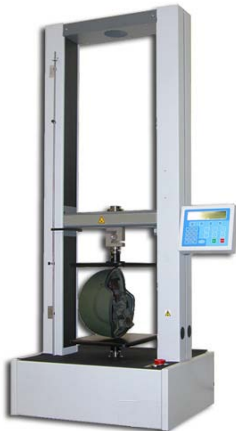
头盔刚性测试图片