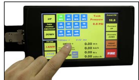
触摸屏控制器技术