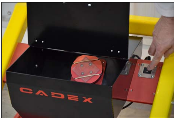
底部容器门更人性化