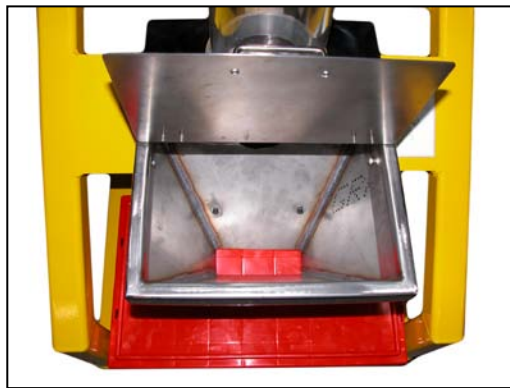
底部容器门更人性化