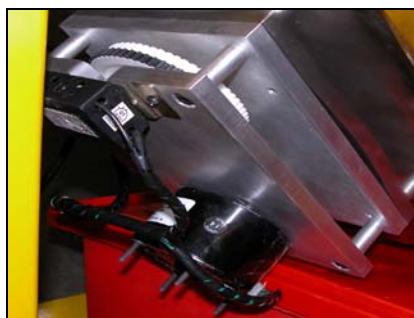
旋转底座样品支架