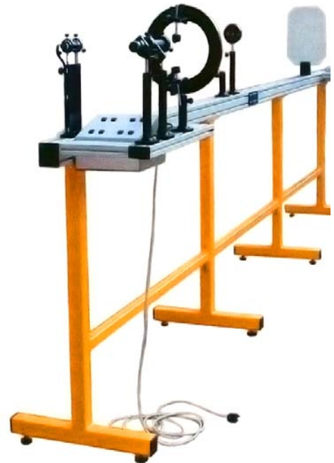
用于测试镜片折射性能的设备。