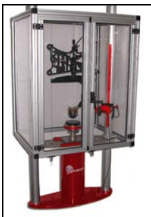
可提供防护罩 (如客户要求).