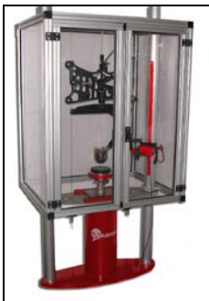
可提供防护罩 (如客户要求)。