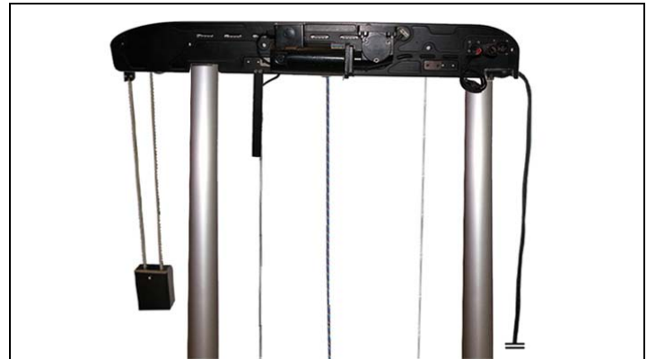
双轨碰撞测试机 - 顶部