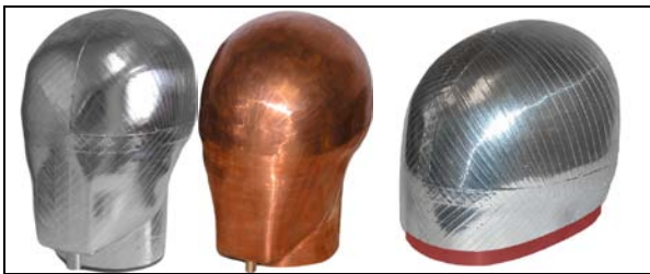
可安装测试感应头型。 (头型没有包括)