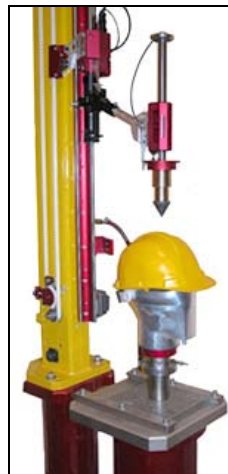
线性穿透冲击头安装在单轨碰撞测试机上效果图