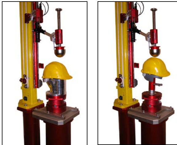
线性碰撞冲击头安装在单轨碰撞测试机上效果图