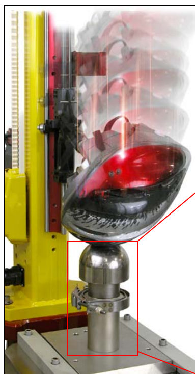
头盔撞击过程中示意图