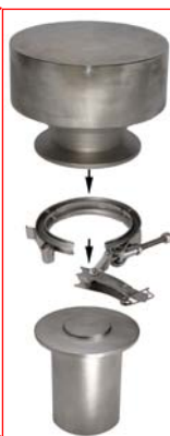
凹模凸模及快拆装置