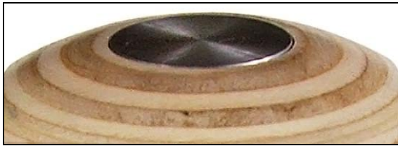
顶部导电软金属块.