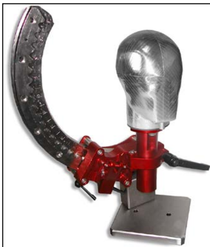
安装在可调节底座上示意图