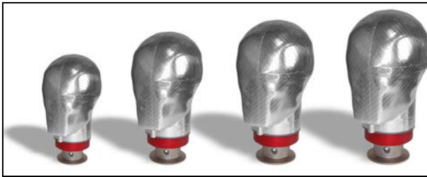
提供可用到的所有尺寸。