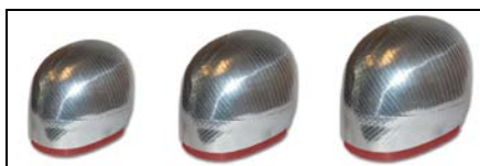
小码, 中码和大码尺寸