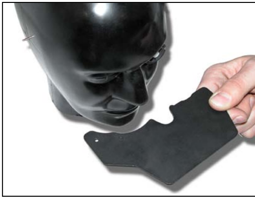
量规板,用于调节传感器的位置