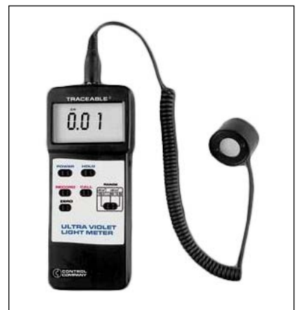
日光/UV 紫外光波长测量仪