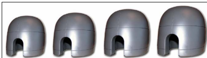
全套尺寸 A, B, C, D.

我们的测试设备始终在不断改进, 因此详细信息可能有所变化。Cadex Inc 公司保留产品更改权利, 恕不另行通知。/ rev 2010c-1