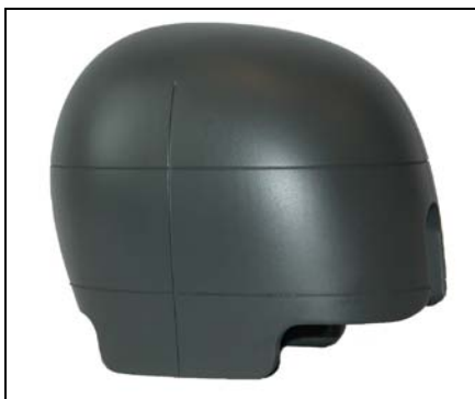
符合 ANSI Z90.1 标准要求的头模 (带有耳部区域)