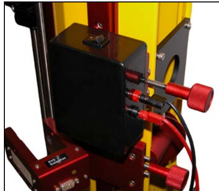
安装在单轨测试机上的后视图。