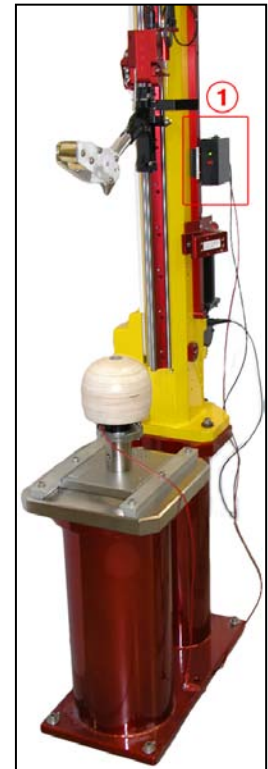
① 控制盒在单轨测试机上的示意图。