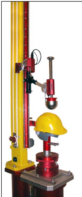
碰撞测试机效果图