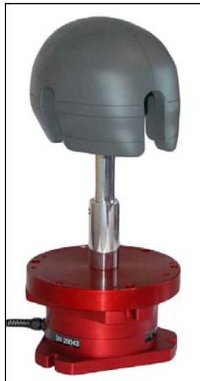
登山盔头模安装效果图