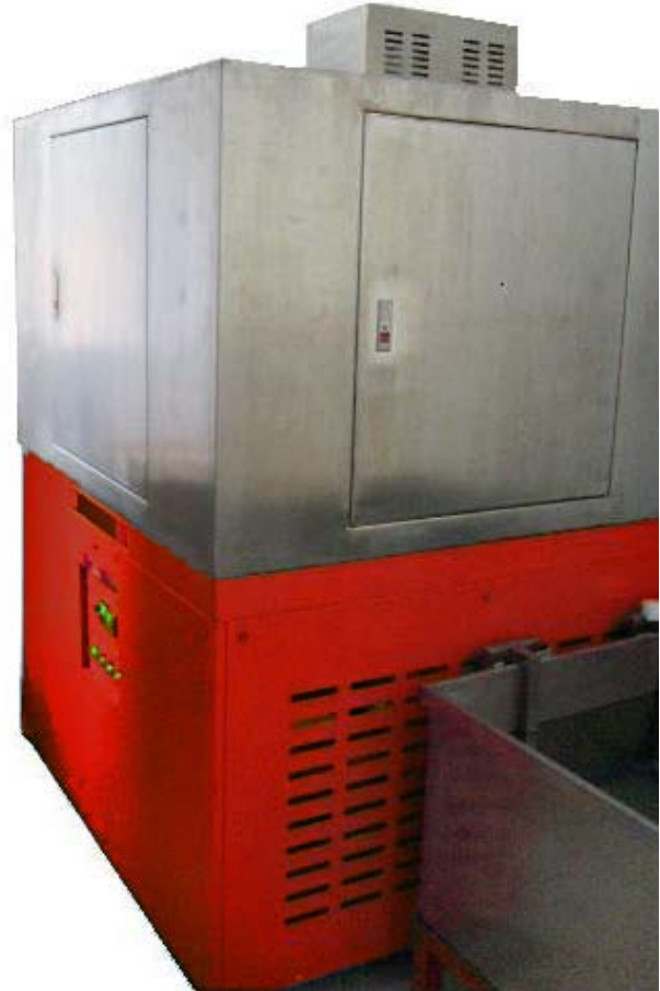
紫外线老化环境箱