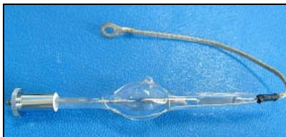
氙气填充紫外线石英灯。