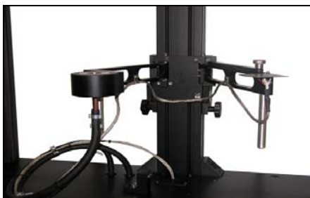
辐射计和热电偶的高度可调