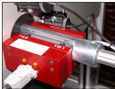
时间门可拆卸, 便于定期校准