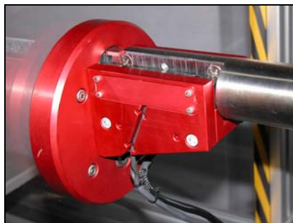
时间门可拆卸, 便于定期校准