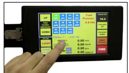
触摸屏控制技术: - 控制系统的开关; - 调节储气罐的压力; - 读取射击速度.