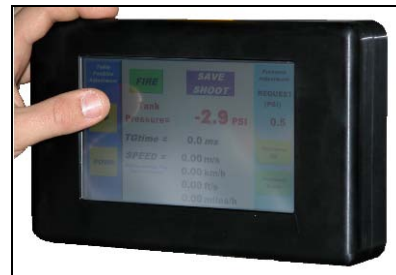
触摸屏控制技术: - 控制系统的开火; - 调节储气罐的压力; - 读取射击速度.

我们的测试设备始终在不断改进, 因此详细信息可能有所变化. Cadex Inc 公司保留产品更改权利, 恕不另行通知. / rev 2010c-1