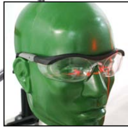
(没有包括测试头型)