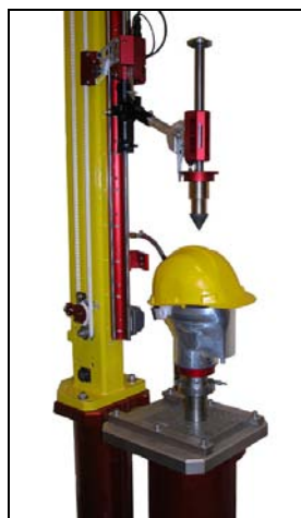
线性穿透冲击头安装在单轨碰撞测试机上。