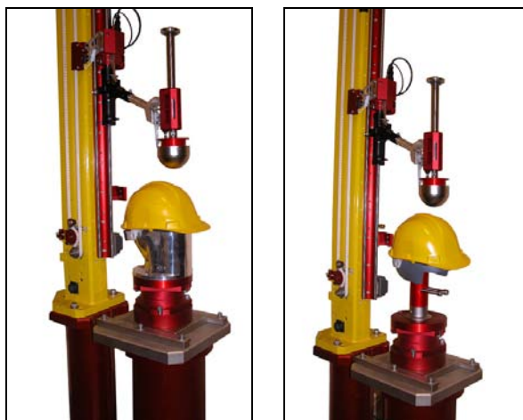
线性碰撞冲击头安装在单轨碰撞测试机上。